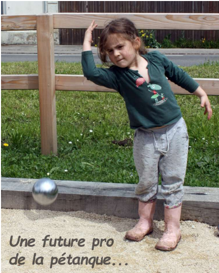
Une future pro de la pétanque...