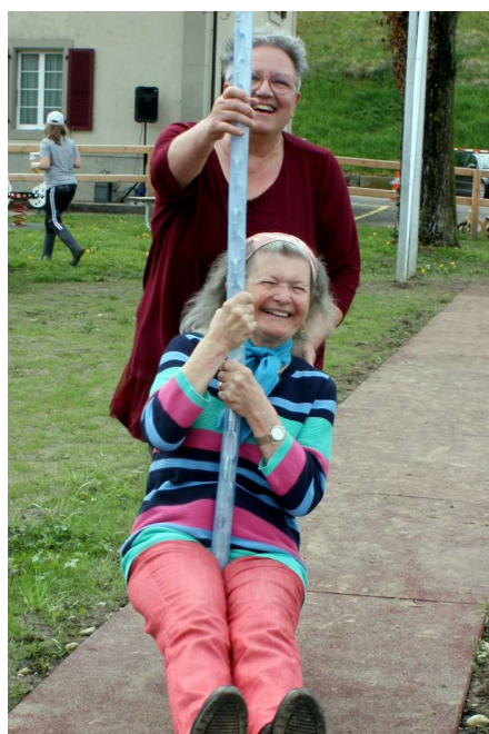
La preuve par l'acte par une de nos doyennes : la tyrolienne n'est pas seulement pour les petits

Fin avril 2023, le moment était enfin venu : une fête magnifique a réuni le village pour inaugurer la nouvelle place autour d'une délicieuse « Raclette » partagée pour l'occasion. Mais surtout pour tirer sur le ruban rouge et permettre ainsi aux nombreux enfants présents d'envahir ENFIN leur place et pouvoir disposer des engins tant