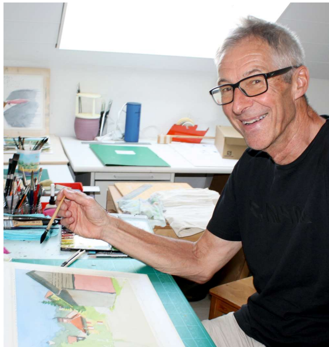
L'artiste dans son atelier, heureux de partager son plaisir de peindre.

Né à Yverdon, CFC de dessinateur industriel en poche, il travaille dans plusieurs métiers