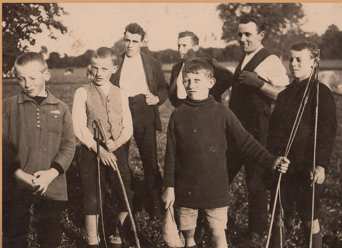
Les reconnaissez-vous ? (2 photos : Collection personnelle de feu Hubert Sonnard)