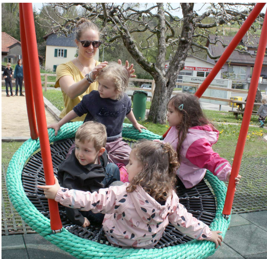
A plusieurs, c'est mieux...

Le groupe de travail qu'il a créé pour l'occasion a travaillé sur cette nouvelle version. En premier, il a été demandé aux enfants du village de dessiner leur place de jeux de rêve. Des images de tours, de toboggans, de balançoires, mais avant tout et sur chaque dessin : une tyrolienne. C'était le must sans quoi rien ne serait parfait. Dès lors impossible de faire sans ! En 2021, à la fin d'une séance de Conseil général, un sondage informel a plébiscité le