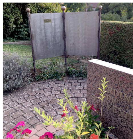
La première plaque apposée sur le livre du souvenir :