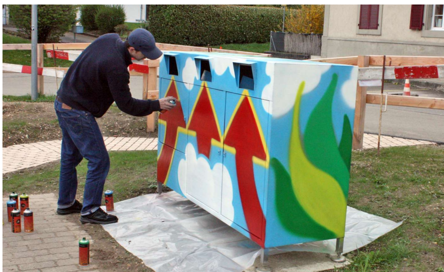
Un résultat qui répond aux attentes de notre commune

Il a toujours aimé s'exprimer par le dessin. Depuis 7 ans, en tant que tatoueur à Yverdon, il prend comme support de ses créations les différentes parties du corps de ses clients.