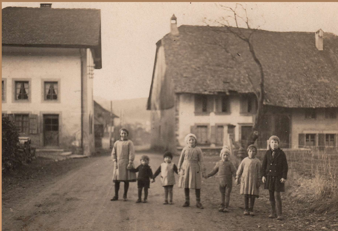
Sur la route principale, devant les maisons des familles Gavin (à gauche) et Cordey (à droite)