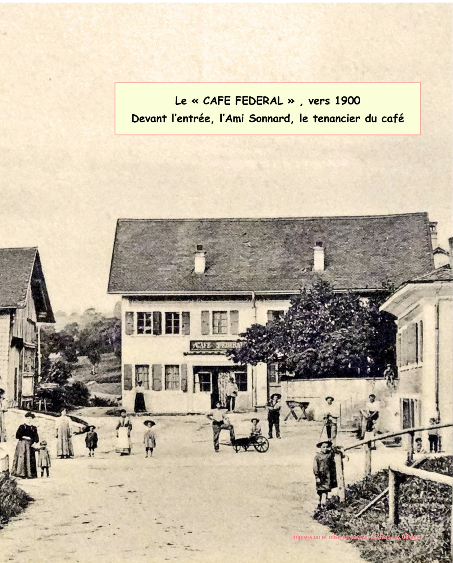
Le « CAFE FEDERAL » , vers 1900 Devant l'entrée, l'Ami Sonnard, le tenancier du café