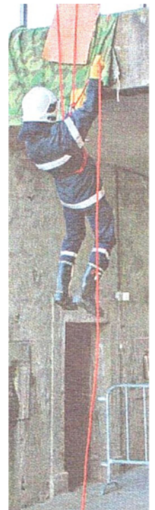
Journal de Moudon 14 mars 2014

La Municipalité remercie chacune et chacun qui offre de son temps à la collectivité publique. www.sdis-hautebroye.ch