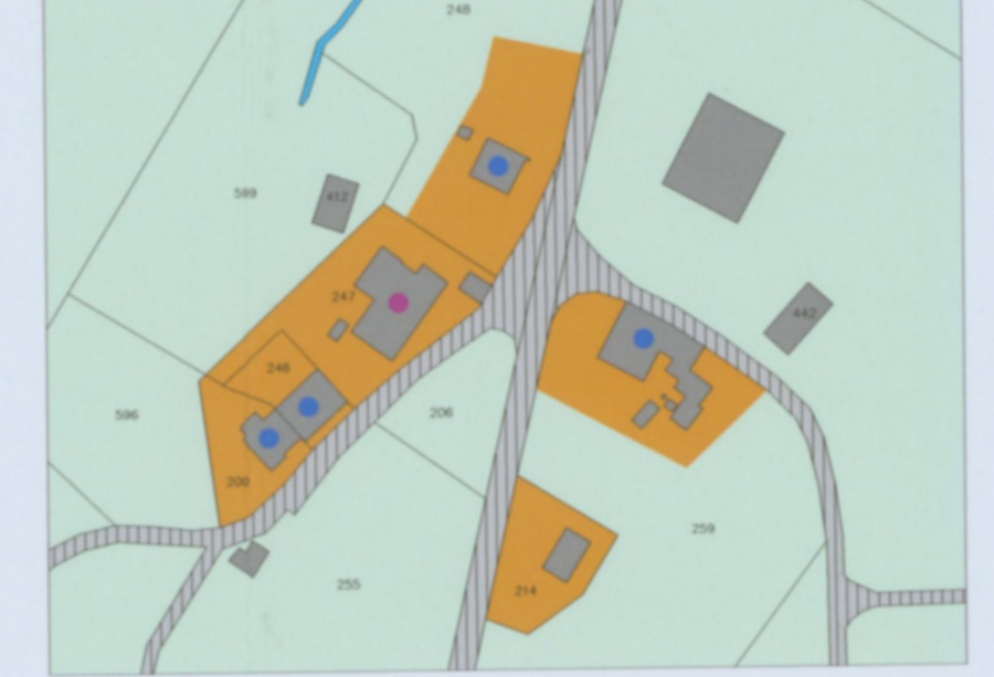
Plan de localisation